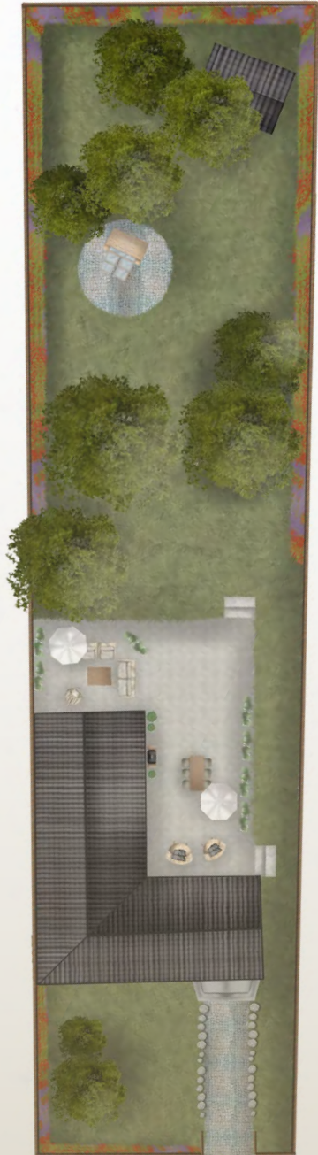
Grundriss des Grundstücks

Gelegen in einer ruhigen 30er Zone Doppelhausbebauung zugelassen Neue Bauten in der Straße zeugen von dem Potenzial der Liegenschaft Einfamilienhaus mit Staffelgeschoss möglich Erste Vorprüfungen beim Bauamt bereits erfolgt Altbestand bereits zum größten Teil abgerissen